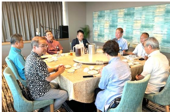
前原会長 最高の笑顔です。