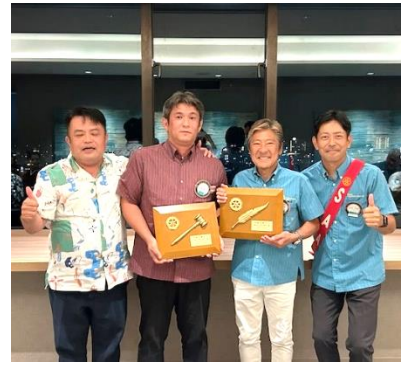
宮城早人会長エレクトより 感謝の記念品贈呈