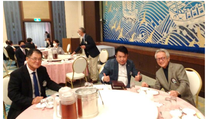
素敵な笑顔で新年がスタートいたしました！今年もよろしくお祈りいたします。